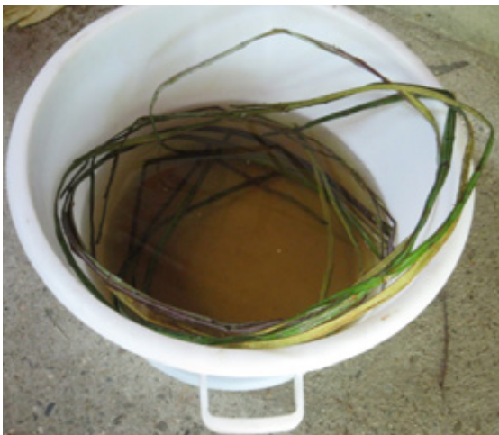
5. Humedecemos las mitades de zarza con agua.