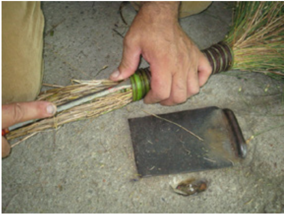
9. Rematamos la punta de la zarza.