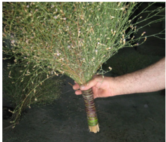
12. Escoba dispuesta para barrer.