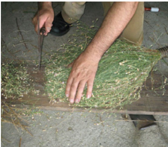
11. Recortamos las flores salientes.