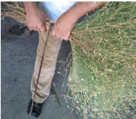
7. Atamos el manajo de escarabiosa con la zarza.