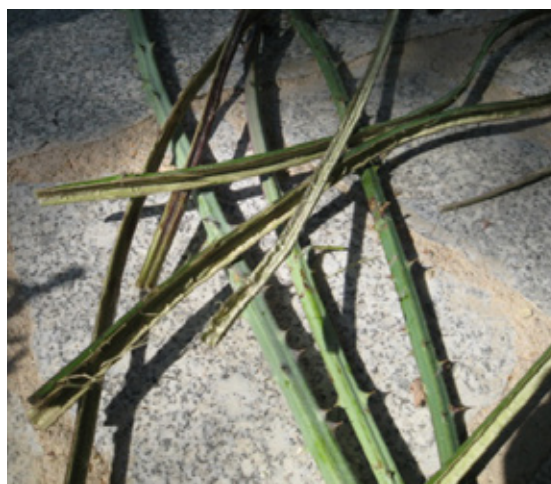
2. Cortamos tallos de zarza verde con una longitud de 1 a 1,5 m.