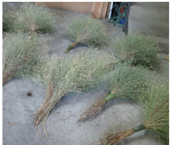
6. Hacemos manojos de escarabiosa.