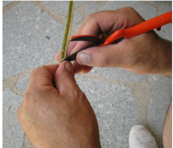
4. Extraemos la pulpa a la zarza.