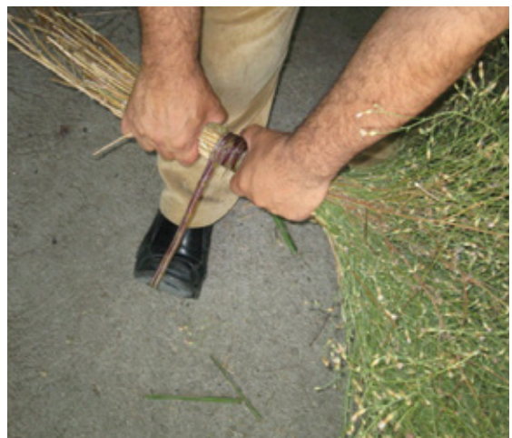
8. Pisamos el extremo de la zarza con el pie.