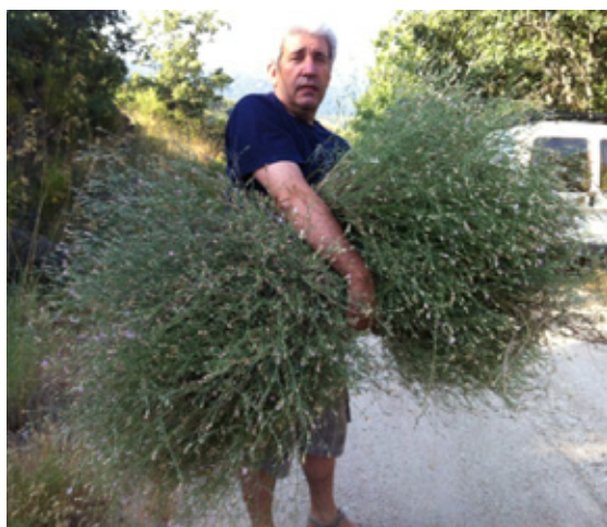
1. Recogemos la escarabiosa en el campo.