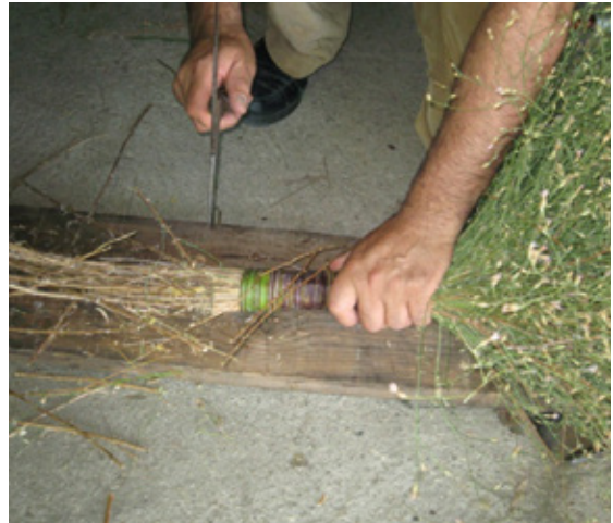
10. Igualamos el extremo duro de la escarabiosa.