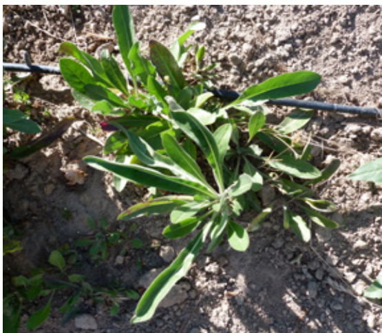
1. Planta de la hierba pastel.