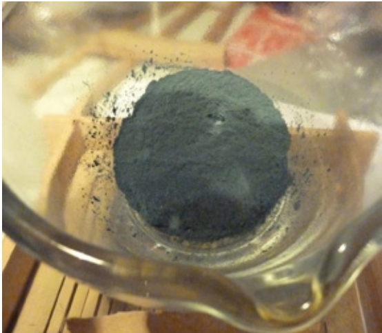
9. Lo dejamos evaporar hasta obtener el polvo para tintar.