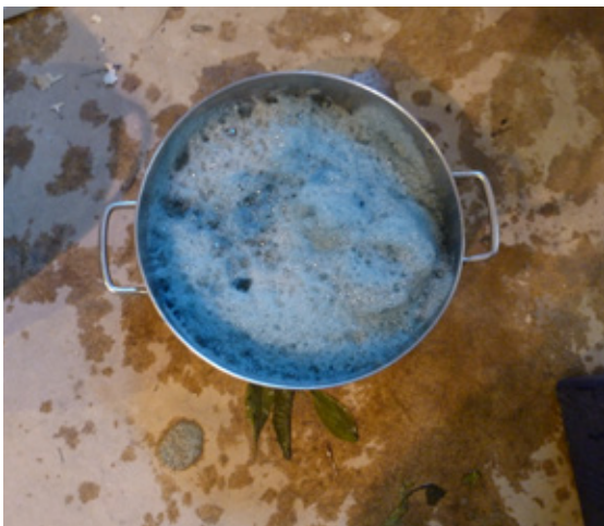
7. Una vez que se ha espumado, lo dejamos reposar.