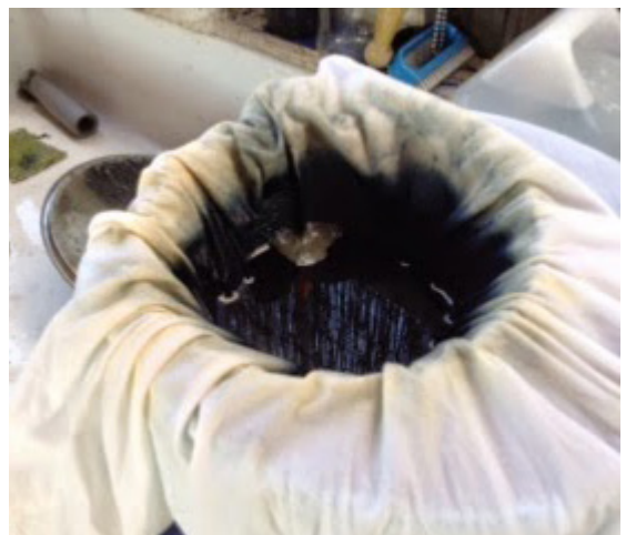
8. Colamos con una tela fina.