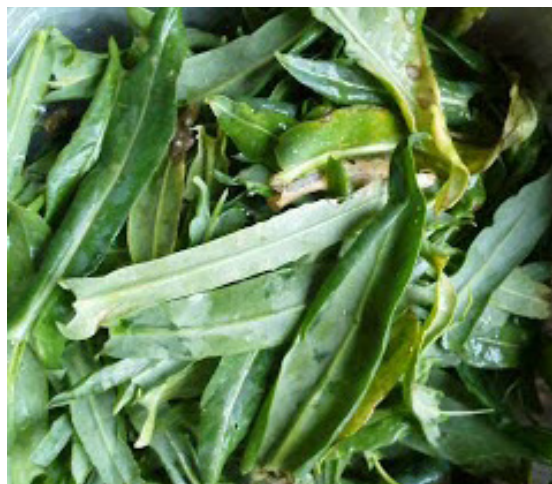
2. Cortamos las hojas.