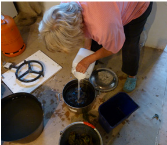
5. Añadimos la cal.