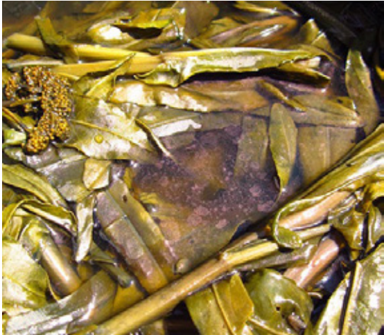
3. Dejamos las hojas macerar.