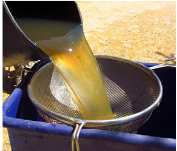
4. Colamos la infusión.