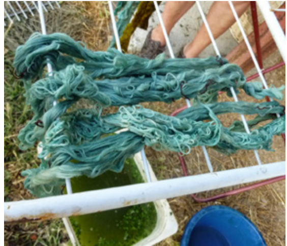
10. Lanas teñidas con tinte de la hierba pastel.