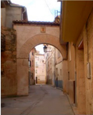
1. Puerta de la Villa.