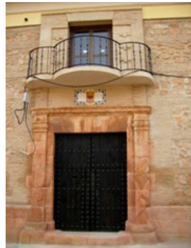
4. Puerta del Palacio de los Palafox.