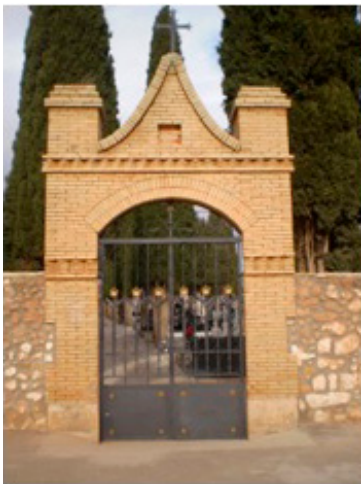
3. Puerta del cementerio.