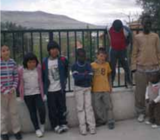
(Continúa de la página anterior: Zafarraya, más cerca de la utopía)