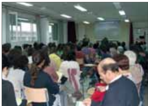
VII Foro de Plataforma Rural

Sociólogo, trabajador y colaborador incansable de las ONG