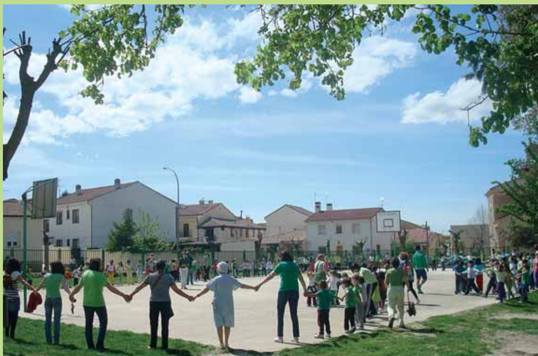
Uno de los actos promovidos desde el AMPA de Boceguillas en defensa de la Escuela Pública