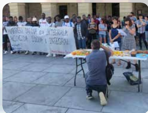
Red de Acogida Solidaria

Abogada de la Coordinadora de Barrios en la Parroquia de Entrevías, San Carlos Borromeo